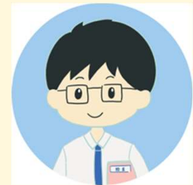
2級FP : S